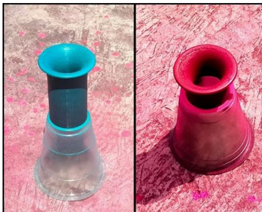
Gambar 4. Bellmouth Finish.