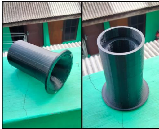
Gambar 2. Bellmouth Panjang.

Berikut ini adalah hasil jadi benda bellmouth 3d dari penggunaan mesin 3d printing yang dapat dilihat pada gambar 2., gambar 3. dan gambar 4.