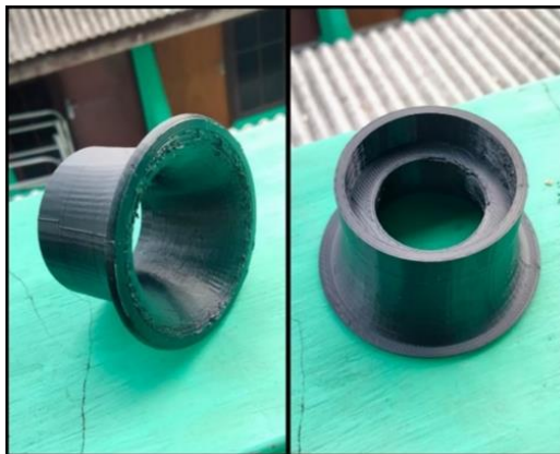
Gambar 3. Bellmouth Pendek.