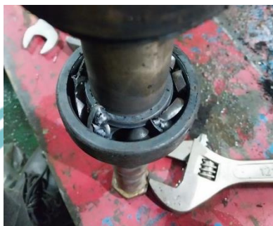
Gambar 1.1 Kondisi kerusakan bearing

perawatan yang dapat diterapkan pada bearing sehingga kerusakan yang sama tidak terulang kembali.