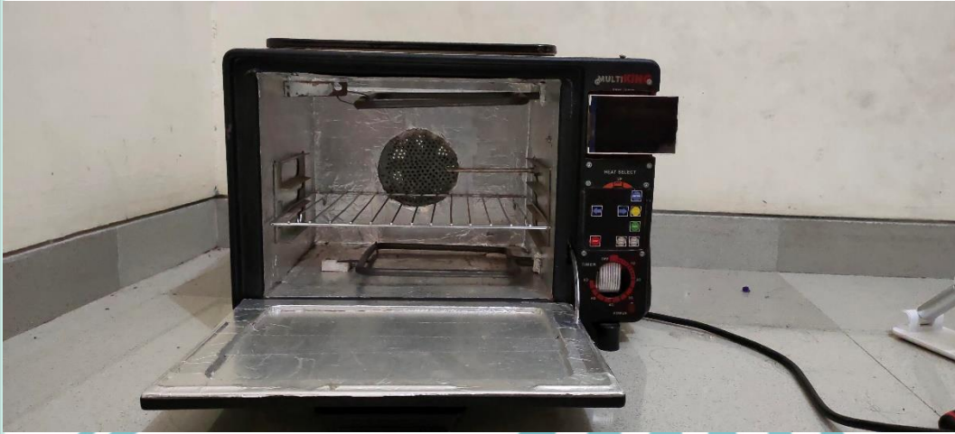
Foto 1. Reflow Oven Tampak Depan