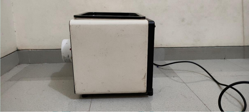
Foto 3. Reflow Oven Tampak Samping