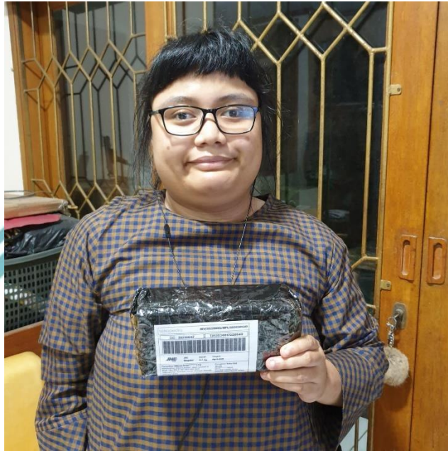
Lampiran 2. Pemilik Toko Uni Shafa mengirim kalung akrilik ke ekspedisi