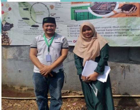
(Wawancara Dengan Direktur LAZ Zakat Sukses)