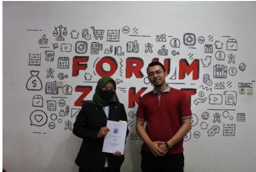
(Wawancara Dengan Kepala Sekolah Amil Indonesia Forum Zakat)