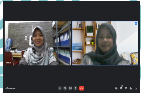
(Wawancara dengan Amil Zakat)