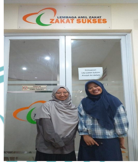
(Wawancara dengan Amil Zakat)