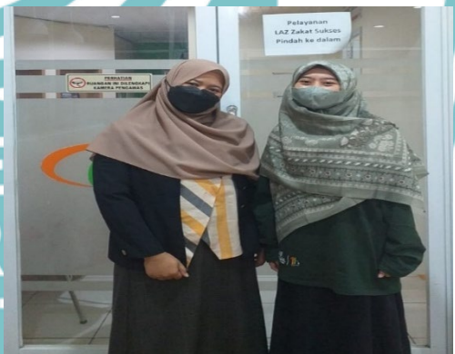
(Wawancara Dengan Supervisor Departemen Finance dan Human Capital LAZ Zakat Sukses)