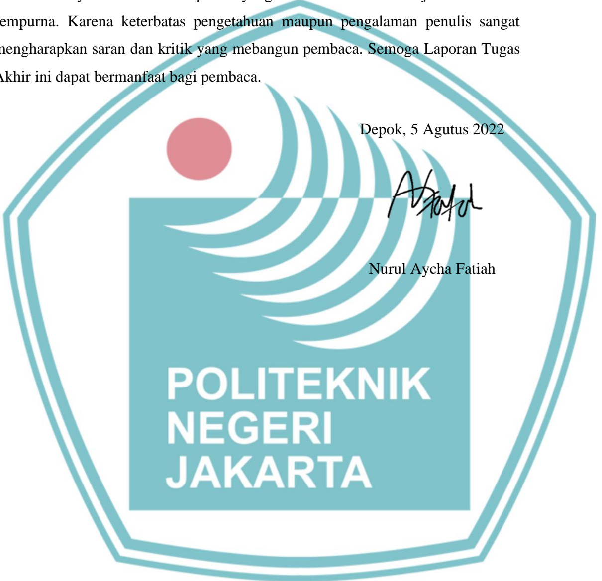
Nurul Aycha Fatiah