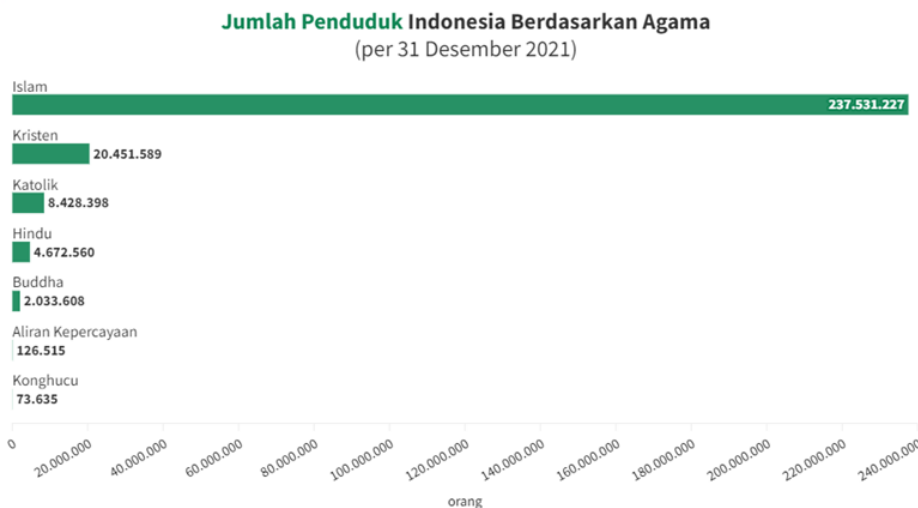
Gambar 1. 1 Perkembangan Jumlah Penduduk Indonesia Berdasarkan Agama

Kemajuan teknologi pada bidang investasi dapat mempermudah masyarakat yang ingin berinvestasi. Sejauh ini investasi di Indonesia selalu mengalami peningkatan, begitu juga halnya dengan investasi syariah. Investasi syariah mulai menunjukkan performa baik dan mulai menarik perhatian investor. Sejak lama masyarakat yang beragama Islam telah menjadi mayoritas penduduk di Indonesia. Islam mengajarkan bahwa segala bentuk transaksi muamalah dapat dilakukan dan hukumnya boleh saat tidak ada dalil yang melarang. Masyarakat muslim yang komitmen dalam menjalankan perintah agamanya maka akan mempertimbangkan keputusannya dalam bertransaksi. Pada penelitian yang dilakukan oleh Aliyah Zahrah Fadhilah Ladamay, et al memberikan hasil bahwa generasi Z yang berasal dari Jakarta sangat setuju untuk memilih produk investasi sukuk karena sukuk merupakan salah satu sarana investasi syariah.