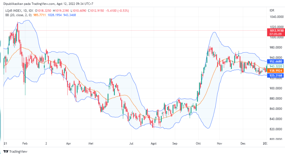
Grafik 1. 2 Volatilitas Indeks LQ45 Tahun 2021

Volatilitas harga juga dialami oleh indeks LQ45 sepanjang tahun 2021 yang dapat dilihat melalui Gambar 1.3 berikut.