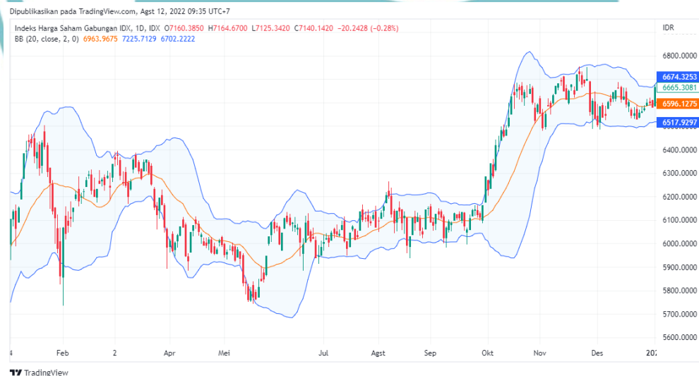
Grafik 1. 1. Volatilitas IHSG Tahun 2021

Keberadaan herding behavior dapat mengganggu volatilitas saham pada pasar modal. Volatilitas saham menunjukkan pergerakan naik turun harga saham akibat tingkat risiko dan return sekuritas yang dihadapi investor pada periode tertentu. Dikarenakan investor cenderung melakukan keputusan investasi dengan mengikuti keputusan investor lain, maka akan menyebabkan tingginya volatilitas yang dapat meningkatkan kesalahan dalam menentukan harga karena terdapat bias dalam mempertimbangkan risiko dan return yang diharapkan (Untari, 2017). Tingkat volatilitas tersebut dapat dilihat dari perkembangan harga yang dilakukan oleh investor melalui indikator teknikal bollinger band pada Gambar 1.2 berikut.