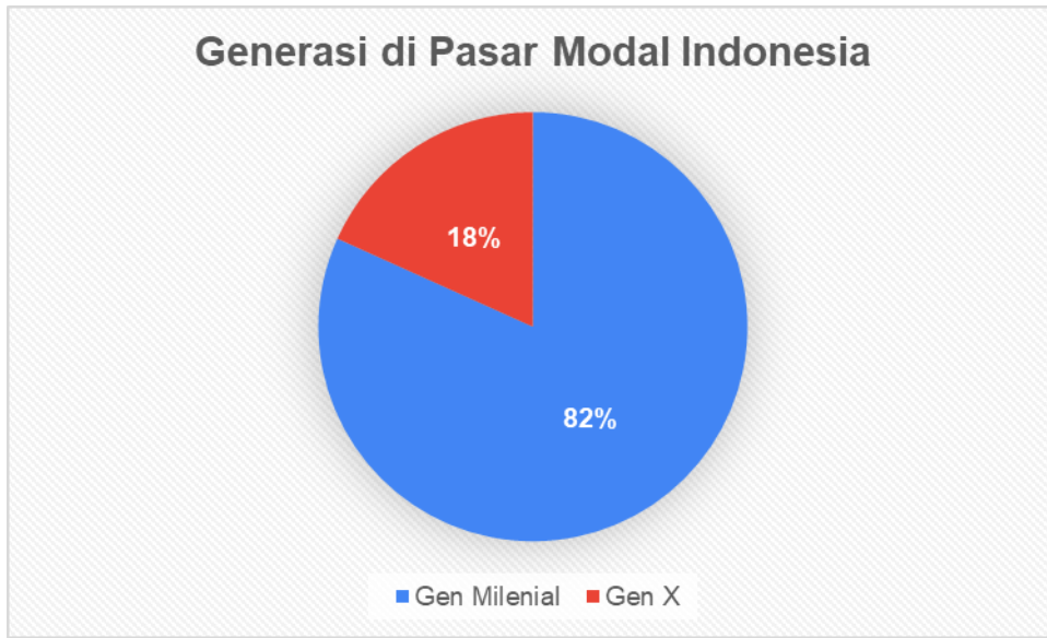
Gambar 1.3 Generasi di Pasar Modal Indonesia