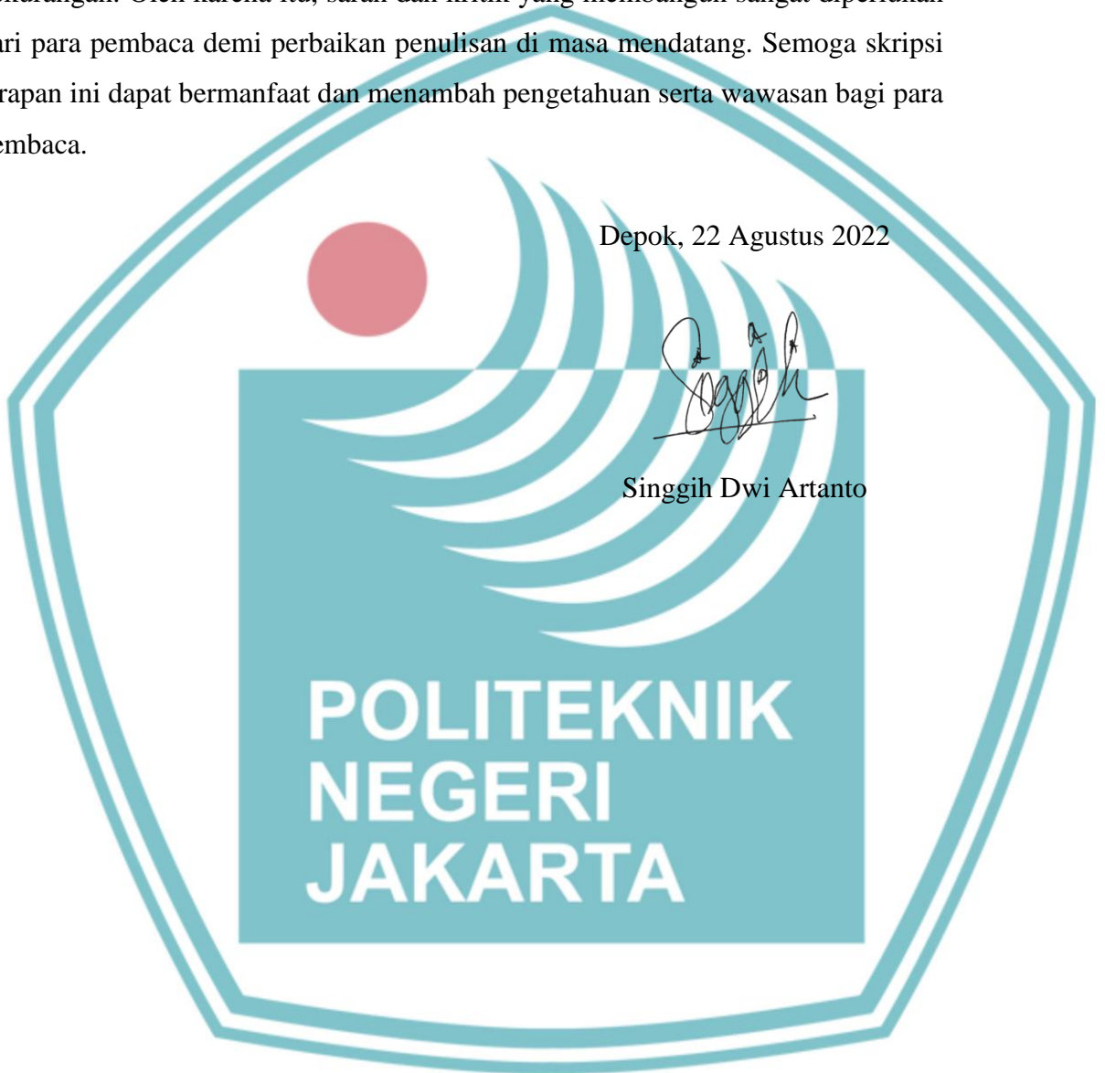
Singgih Dwi Artanto