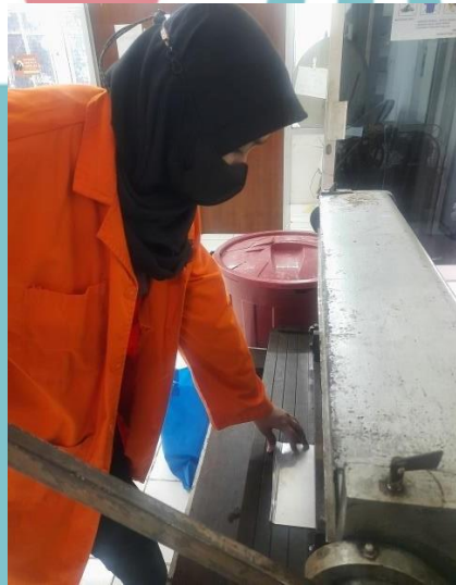
Membuat Casing Alat