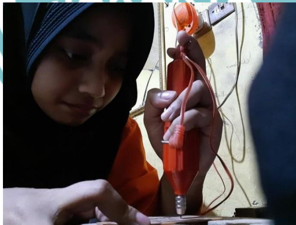
Mengebor PCB untuk kaki komponen yang digunakan sebagai nantinya untuk Power Supply