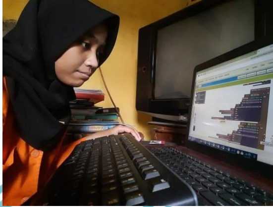
Membuat Program Aplikasi Android pada MIT App Inventor