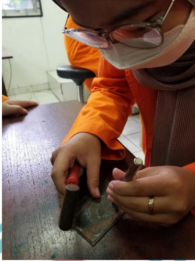
Menandai Dengan Penitik Pada PCB Untuk Power Supply