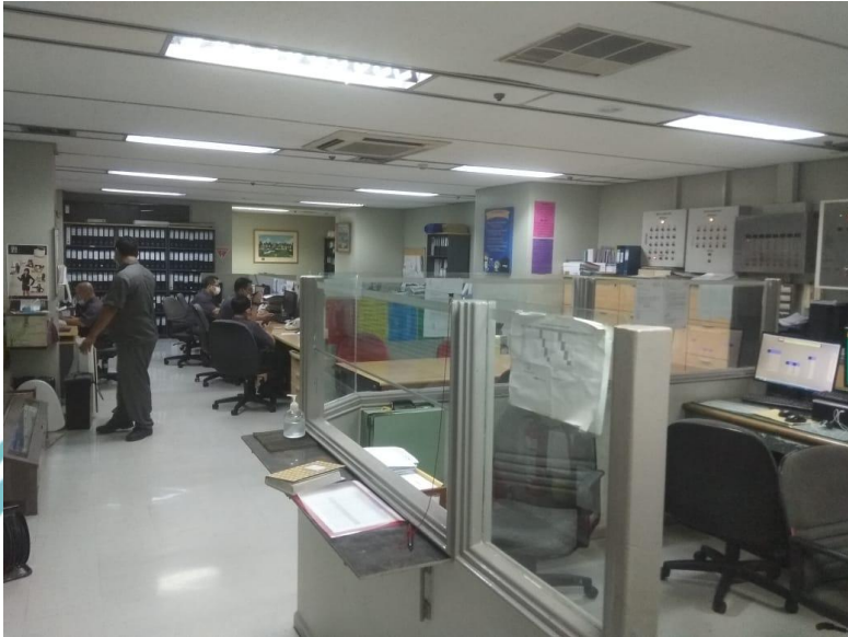
Ruang Maintenance Midplaza Prima