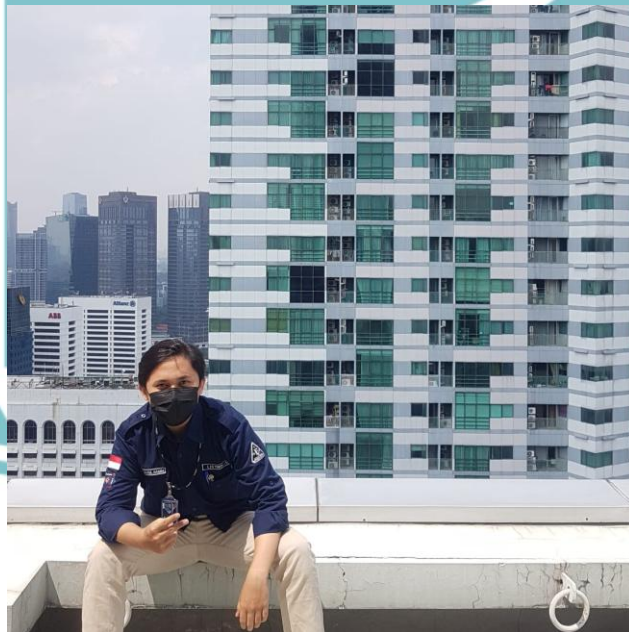
Dokumentasi Foto Dilantai 26 Gedung Midplaza 2