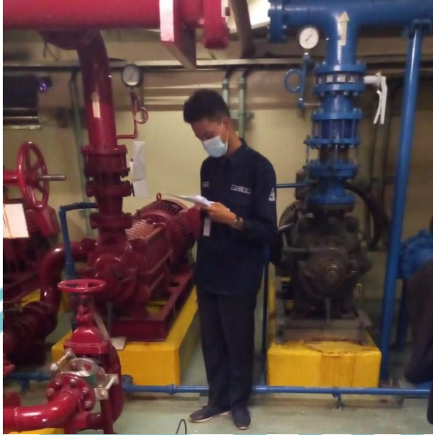
Pump Room Basement 2