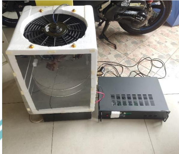
Gambar L- 1 Foto Keseluruhan Alat Tampak Atas