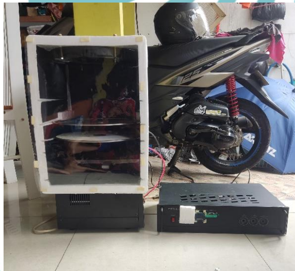
Gambar L- 2 Keseluruhan Alat Tampak Depan