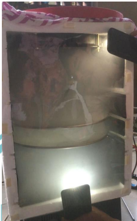
Gambar L- 3 Foto Pengujian dengan Asap Rokok