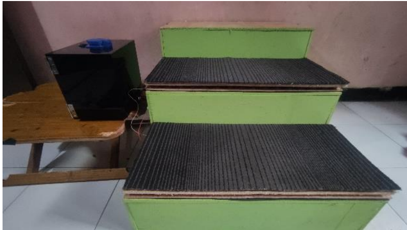
Gambar L- 1 Foto keseluruhan Alat