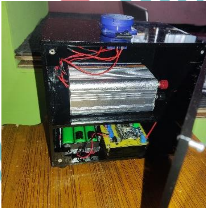
Gambar L- 2 Bagian dalam Box alat