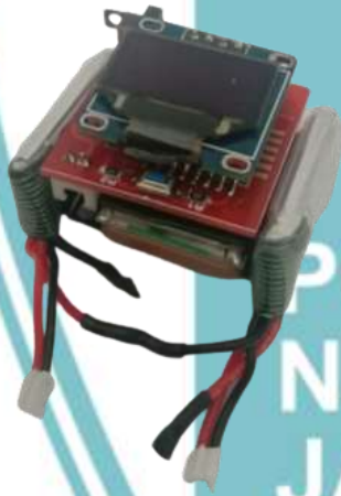
Gambar L-3 Tampak Atas Foto Alat