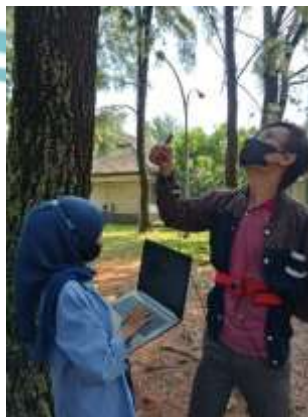
Gambar L-5 Pengujian pada lokasi pertama