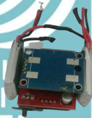
Gambar L-4 Tampak Bawah Foto Alat