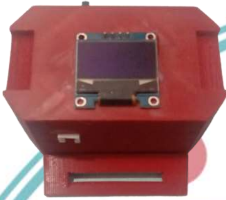
Gambar L-1 Tampak Depan Casing Alat