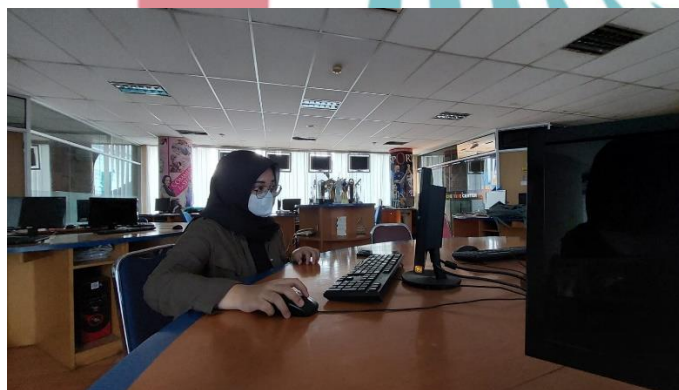
Foto saat melaksanakan praktik Industri