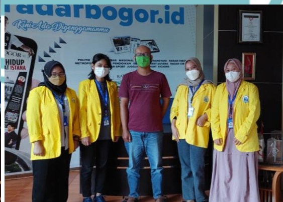
Foto dengan Pemimpin Redaksi RBG.id

© Hak Cipta milik Politeknik Negeri Jakarta