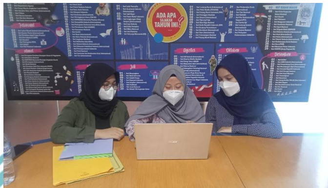
Foto Dokumentasi Penulis Saat Praktik Industri dan Wawancara