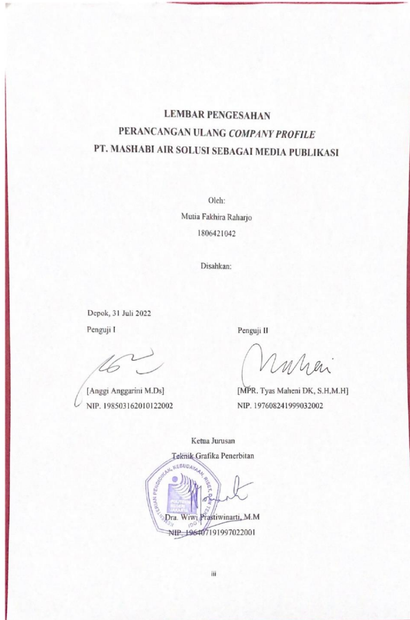
Lampiran 6 Lembar Pengesahan dengan cap basah