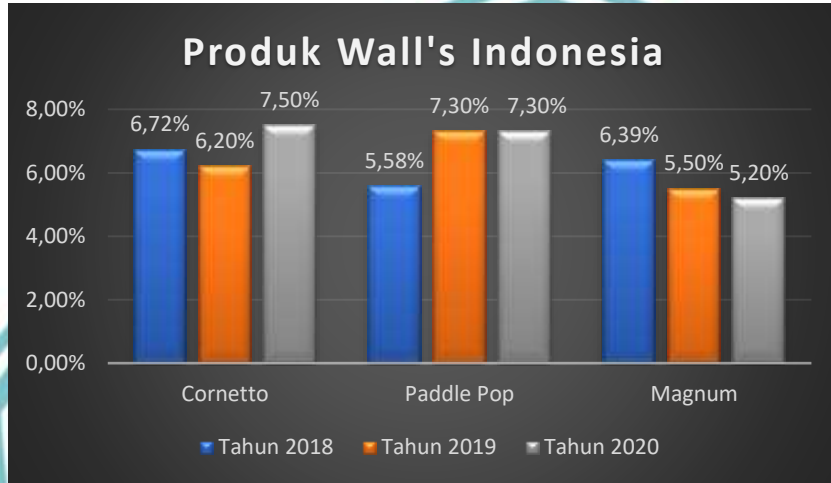
Gambar 1.1. Peningkatan penjualan Produk Wall's Indonesia

masih terkuat dalam industri es krim dibandingkan kompetitor yang sejenis produk wall's lainnya.