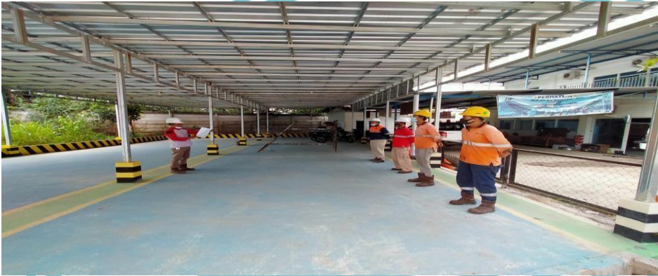
Safety Officer Sedang Memberikan Arahan