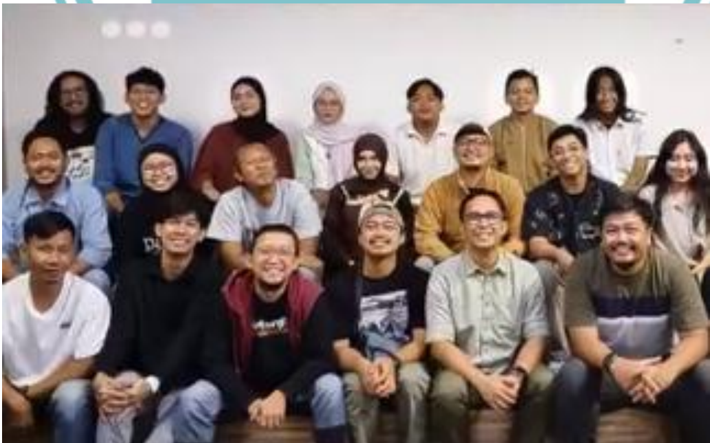
( Dokumentasi penulis saat menghadiri rapat kordinasi untuk pemantapan tim dokumenter TV Tempo)