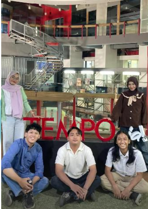
( Dokumentasi penulis dengan rekan-rekan magang yang lainnya yang berada di TV Tempo )