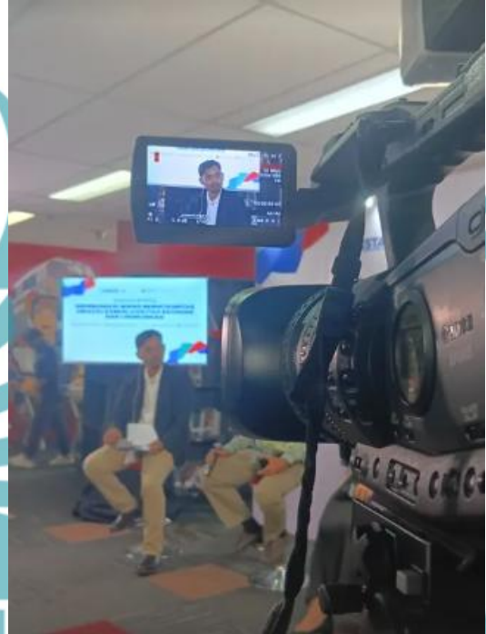
( Dokumentasi penulis saat diberikan tugas menjadi videografer di TV Tempo )