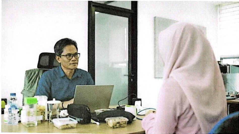
Gambar Lampiran Wawancara Manager Redaksi Tribunnews Bogor