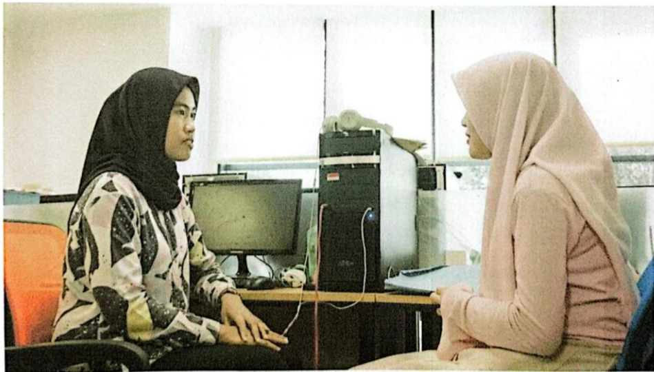
Gambar Lampiran Wawancara Editor Redaksi Tribunnews Bogor

© Hak Cipta milik Politeknik Negeri Jakarta