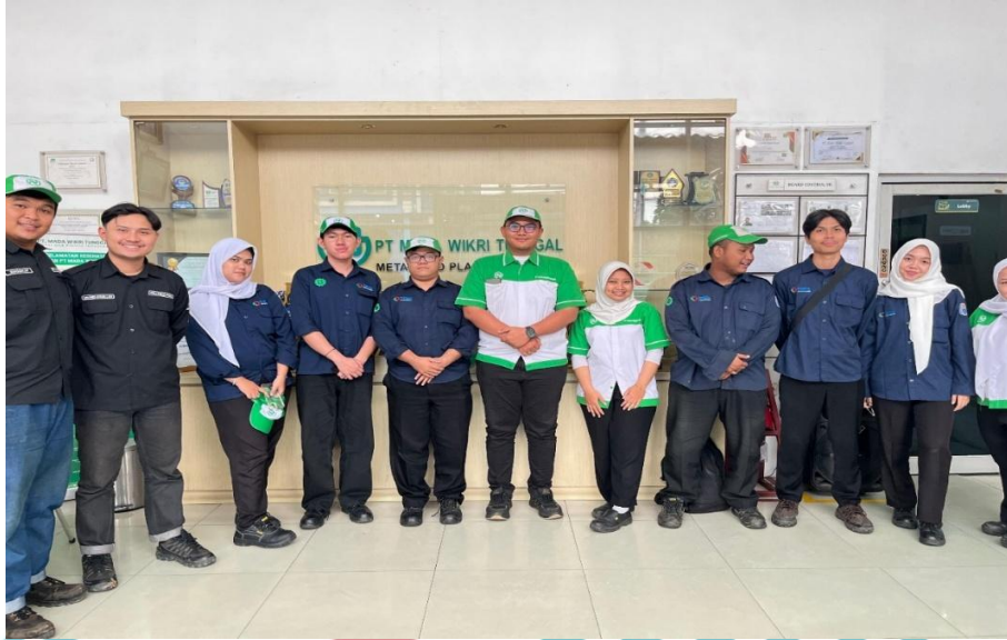
Foto Bersama Pembimbing Industri