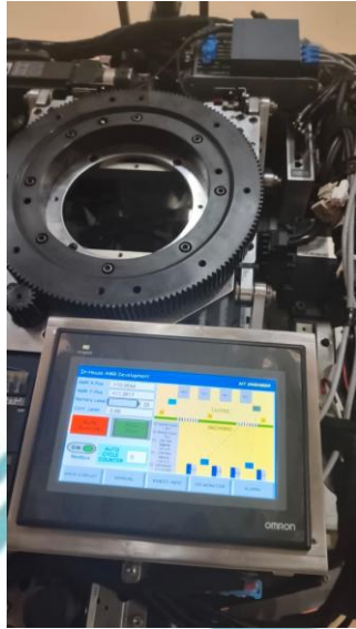
Lampiran 10 Dokumentasi kegiatan