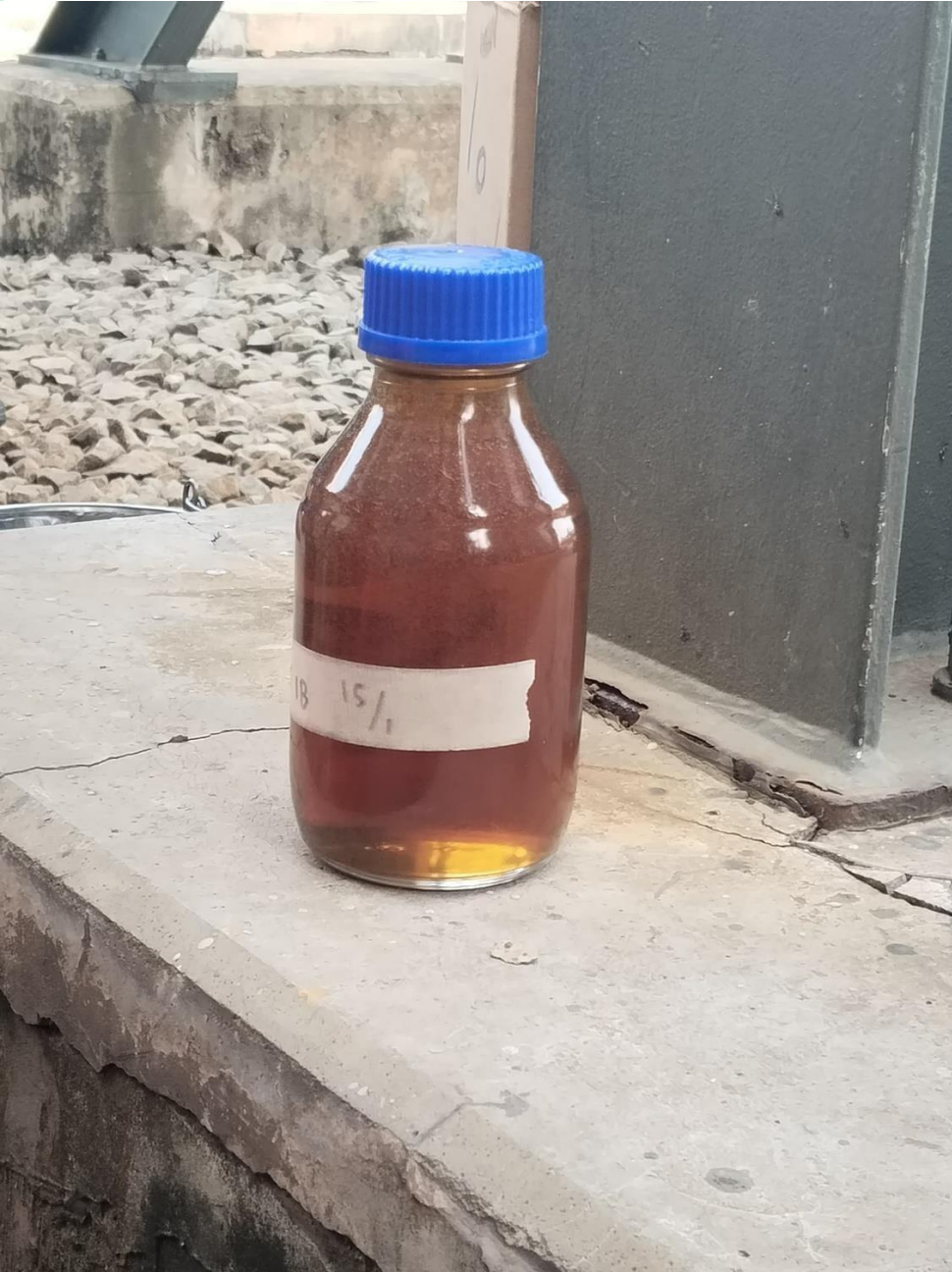
Lampiran 4. Sampel Oli