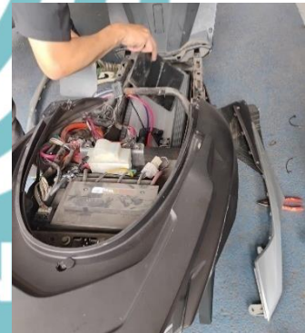
Mengurus pergantian baterai motor listrik