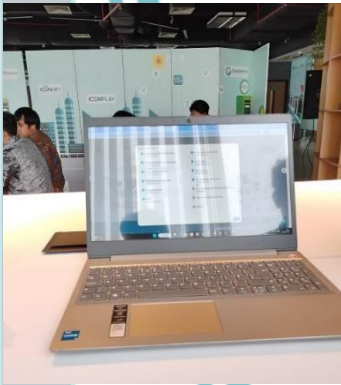
Monitoring Backlog Home Charging Services