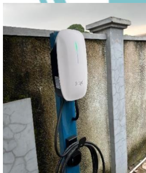
Pemasangan Instalasi Home Charging pelanggan