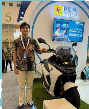
Menjadi Juru Penerang produk EV