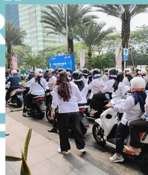
Pengantaran unit kendaraan untuk acara PNM Green Move