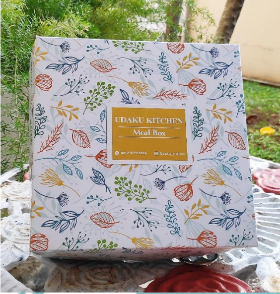
Foto penerapan desain identitas visual UDAKU KITCHEN yang baru

Foto penerapan desain identitas visual UDAKU KITCHEN yang lama