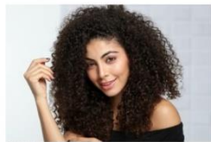
Berambut keriting

MATA INDONESIA, JAKARTA – Bagi Anda pemilik rambut keriting, mungkin masalah yang kerap Anda hadapi adalah kusut dan sulit diatur. Padahal sebenarnya, cara merawat rambut keriting tidak sesulit yang dibayangkan.