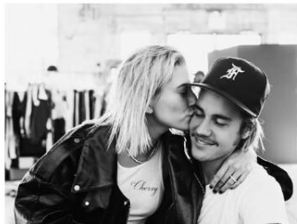
Justin Bieber dan Hailey Baldwin

Sustainable investing Manulife Investment Management