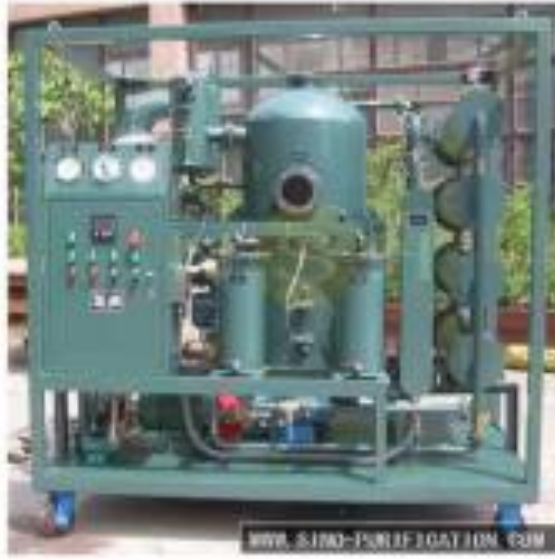
Gambar 1.1 Regenerator Unit

Regenerator Unit adalah sistem yang digunakan untuk mengembalikan kemampuan resin penukar ion agar dapat kembali berfungsi dalam proses pemurnian air. Proses regenerasi berfungsi untuk menukarkan ion pengotor air yang terikat pada resin dengan ion pada regeneran yang bermuatan sama.[2]