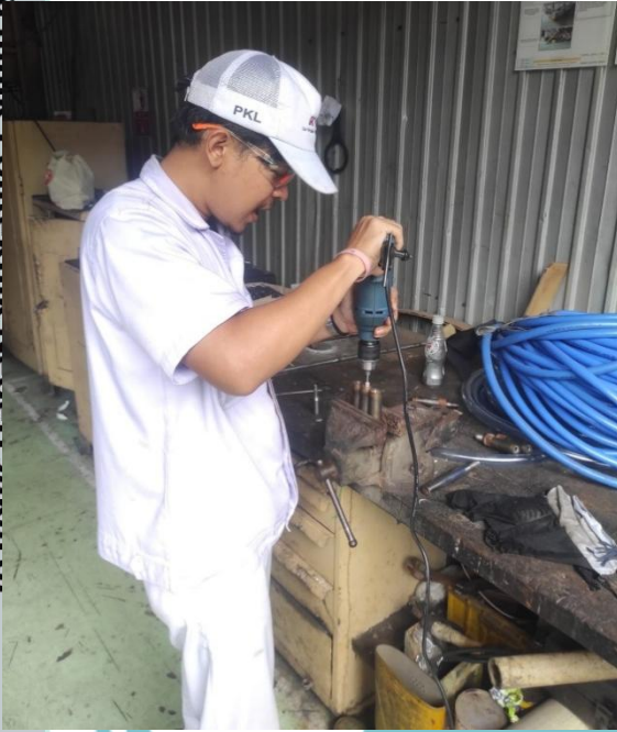
Lampiran 6 Repair Konektor line PRP 4