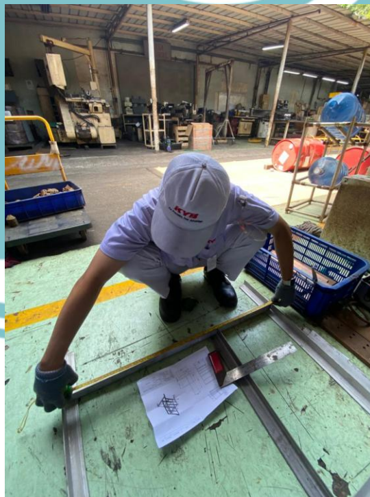
Lampiran 8 Proses Pematangan Siku