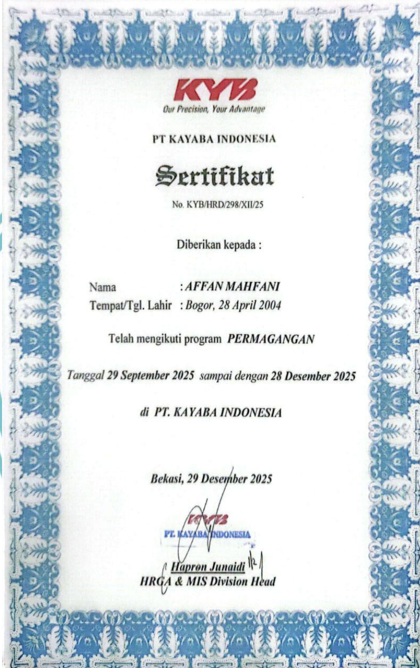
Lampiran 1 Sertifikat PT Kayaba