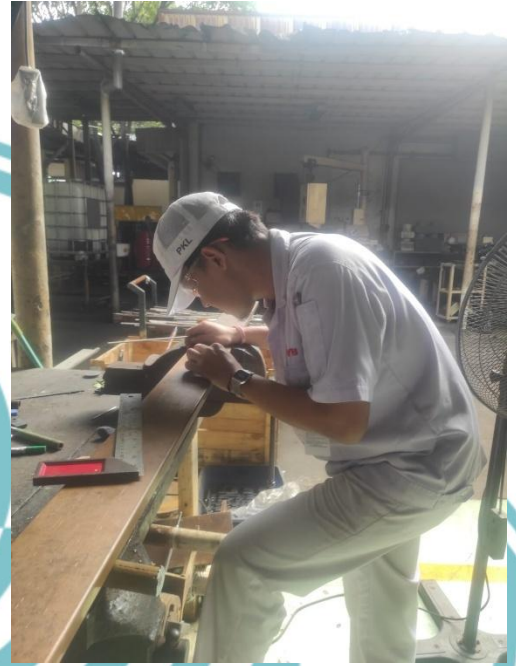
Lampiran 7 Sketch Bushbar Anoda