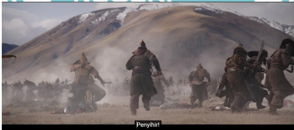
Gambar 1.1 Contoh Subtitle pada film Mulan 2020

Salah satu contohnya adalah film “Mulan” merupakan film drama laga perang yang pertama kali tayang pada 4 september 2020 karya Niki Caro dari produksi Walt Disney Pictures. Film tersebut adalah film live-action buatan ulang dari film animasi “Mulan” yang diproduksi pada tahun 1998 oleh Disney. Film ini berdasarkan legenda Tionghoa pada abad ke-5 yang tertulis dalam cerita “The Ballad of Mulan”, yang mengisahkan tentang pahlawan perempuan yang ikut dalam pasukan perang kekaisaran.