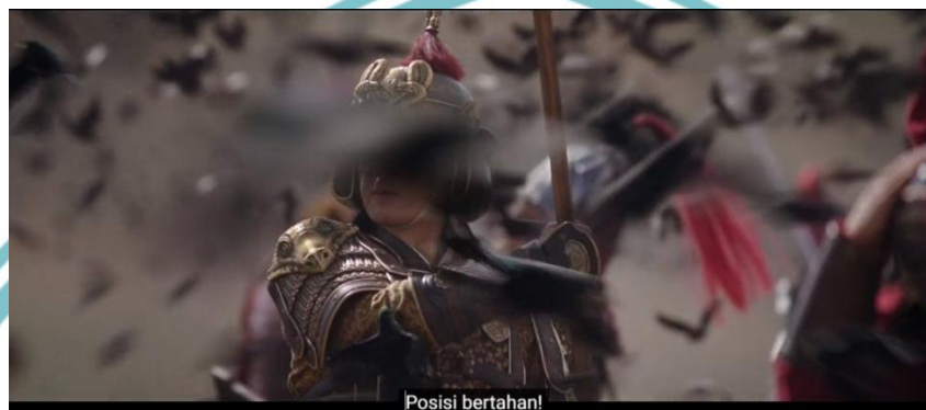
Gambar 1.2 Contoh Subtitle pada film Mulan 2020

Film ini termasuk karya yang populer di pasaran dilihat dari banyaknya penonton. Tingginya minat penonton membuat film Mulan tidak hanya terdiri dari bahasa Inggris tetapi juga bahasa Indonesia. Dengan memberikan teks terjemahan ( subtitle ) versi bahasa Indonesia.