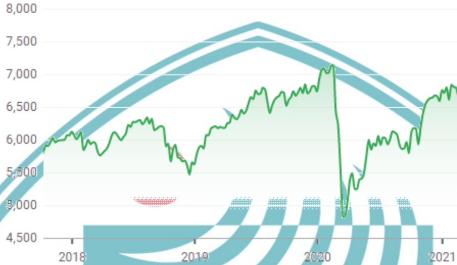
Grafik Perkembangan Indeks CSI 300