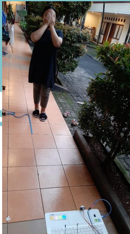
Saat melakukan pengujian jarak