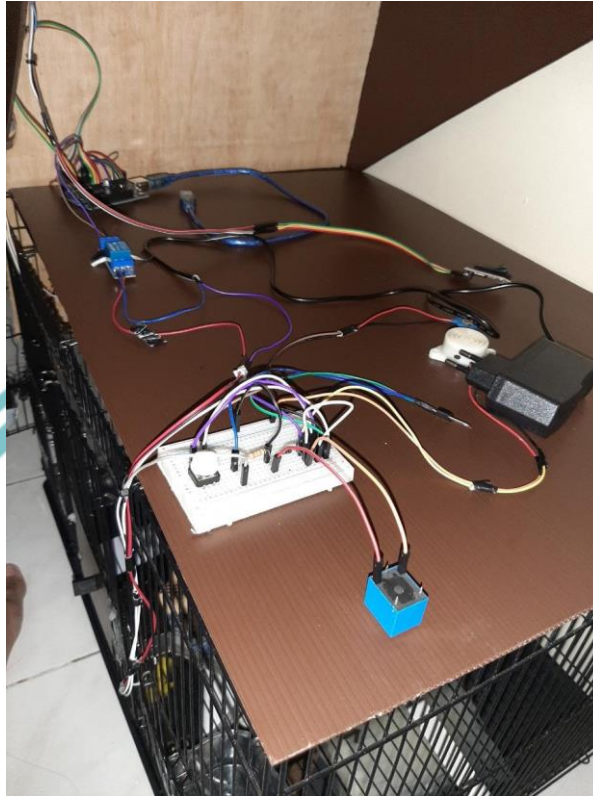
Rangkaian Sistem Keamanan Kandang Burung Berbasis IOT