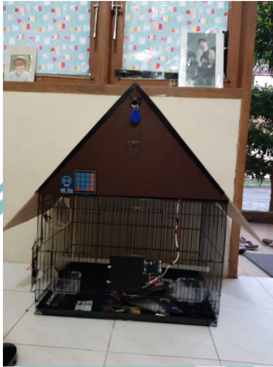
Prototipe Kandang Burung