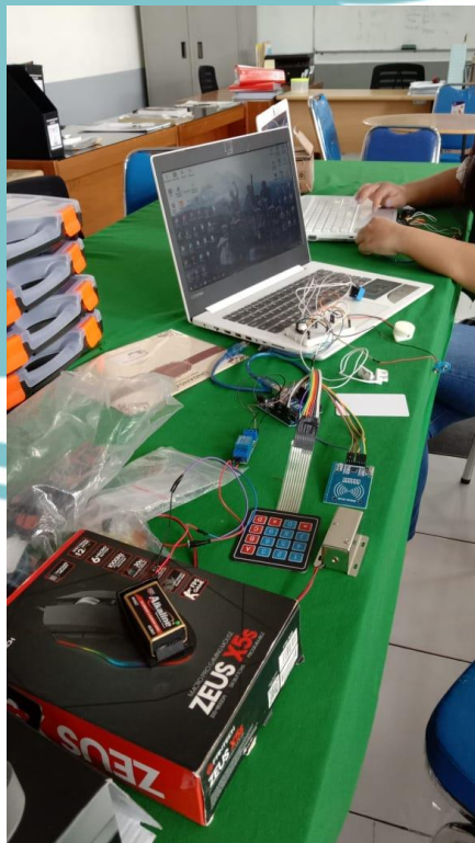
Dokumentasi Saat Demo Alat ke Pembimbing