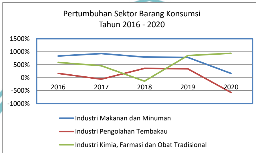
Gambar 1.1. Grafik Pertumbuhan Sektor Barang Konsumsi terhadap PDB tahun 2016 - 2020

pertumbuhan yang baik tiap tahunnya dan berkontribusi besar bagi Produk Domestik Bruto (PDB) Indonesia. hal tersebut dapat dilihat dari grafik pada gambar pertumbuhan sub sektor barang konsumsi pada tahun 2016 – 2020.