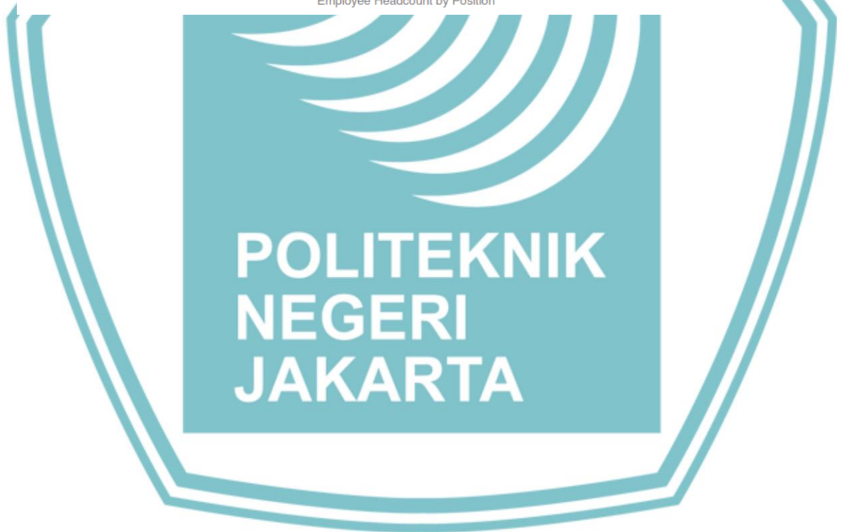
Jumlah dan Komposisi karyawan Berdasarkan Jabatan Employee Headcount by Position