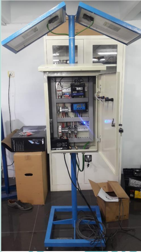
Foto 2. Bagian dalam panel

Foto 1. Foto rancang bangun sistem monitoring limbah cair