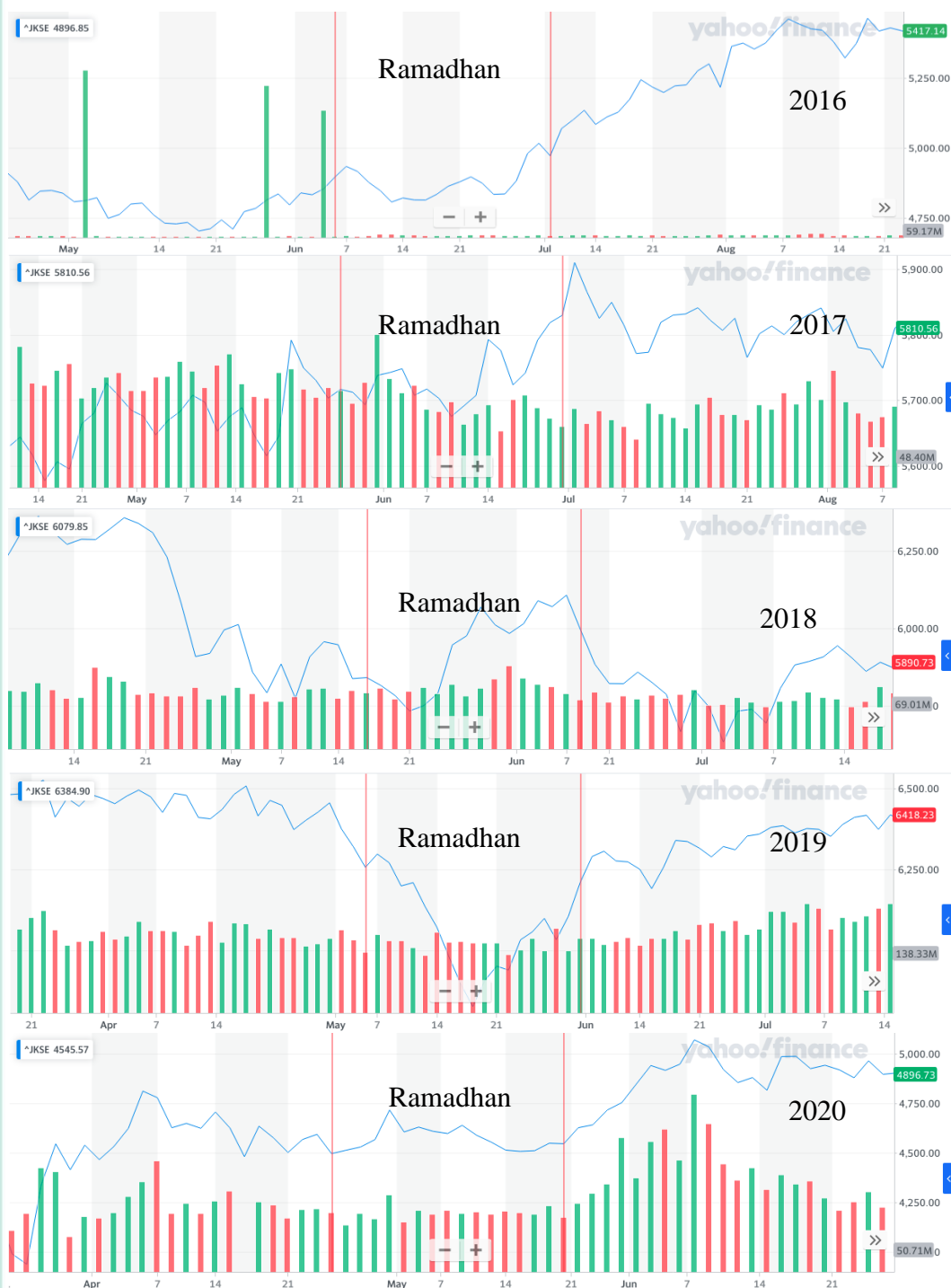
Gambar 1. 1 IHSI Periode Ramadhan (2016-2020)

menunjukkan fenomena Ramadhan Effect pada sisi aktifnya transaksi yang dilakukan.