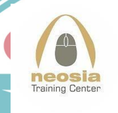
Gambar 1. 1 Logo PT Neosia Pratama Indonesia

Neosia Training Center adalah sebuah Lembaga Pendidikan dan Pelatihan yang telah berdiri sejak tahun 2009 dan hadir untuk mengisi kekosongan terhadap langkanya program pelatihan Engineering Software didalam meningkatkan kompetensi dalam bidang design khususnya aplikasi “ Engineering Software ”.