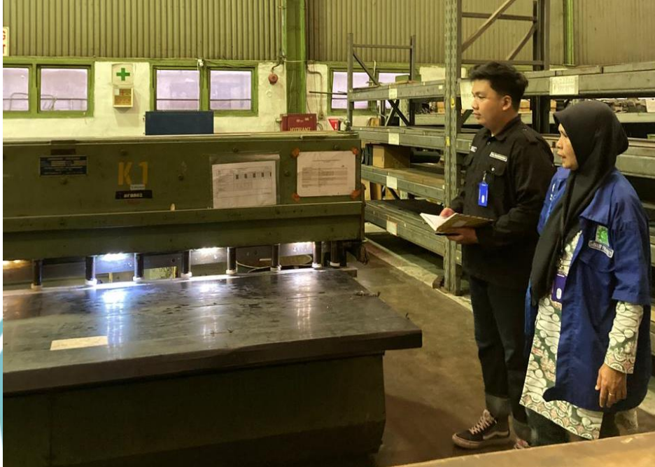
Lampiran 1 Observasi lapangan dan wawancara