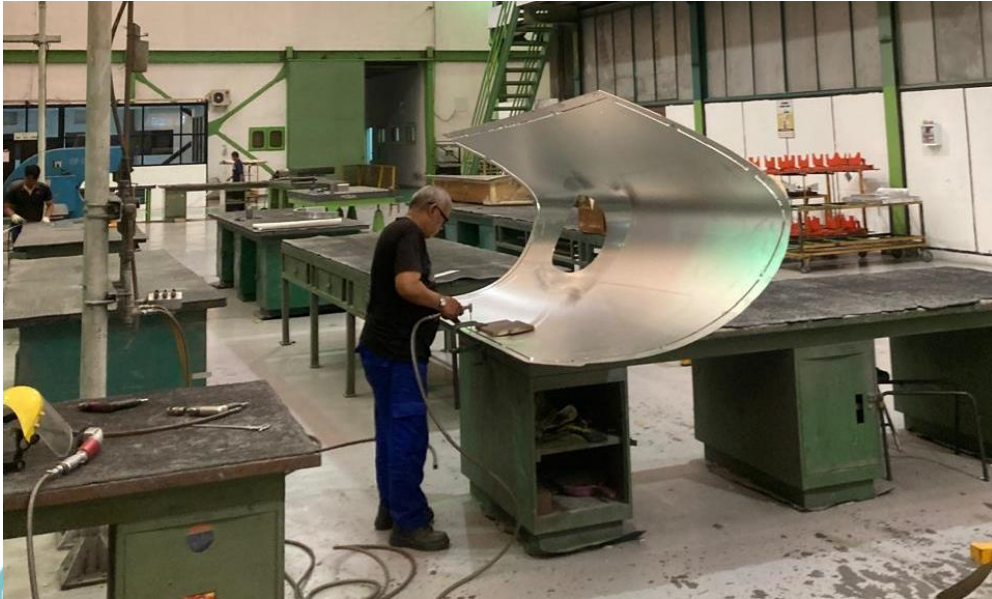
Lampiran 2 Proses fitter for stretch forming