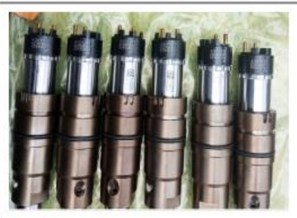
Detail New Part Installed