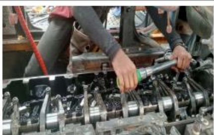
Process of completed component