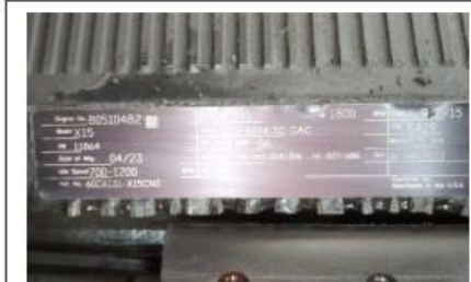
Engine SN: 80510482