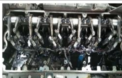
Picture of completed installation new injector