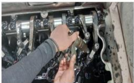
Process of new injector installation