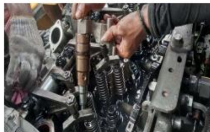
Process of new injector installation