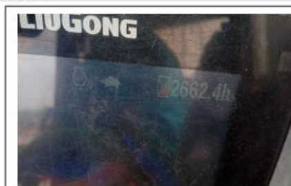
Failed Hour Meter: 2662 hrs