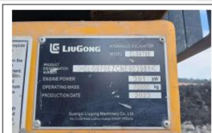
Machine Serial Number: CLG970E2CNE903981