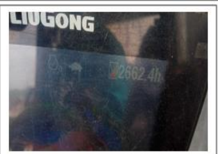
HM Repair Finish