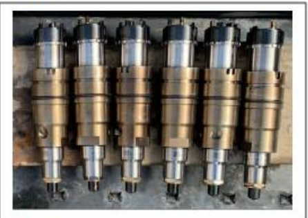
New Part Installed