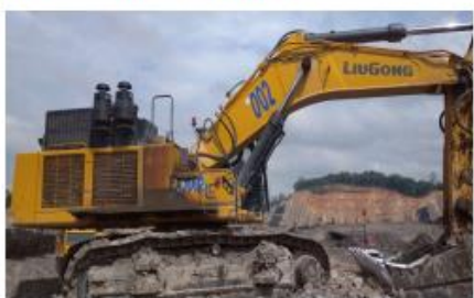
Machine ready for use