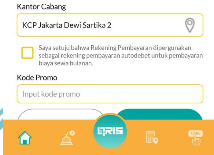
Gambar 4. 9 Pemilihan Kantor Cabang