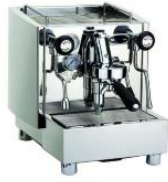
Alex PID Semi Professional Espresso Machine