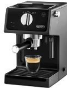
Delonghi ECP 31.21 For Home & Small Cafe