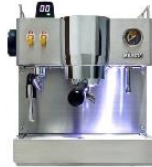
Milesto II Eliane Espresso Machine Small & Medium Cafe Espresso Machine