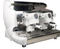
Sorrento Commercial Espresso Machine