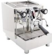
Alex Duetto IV Professional Espresso Machine