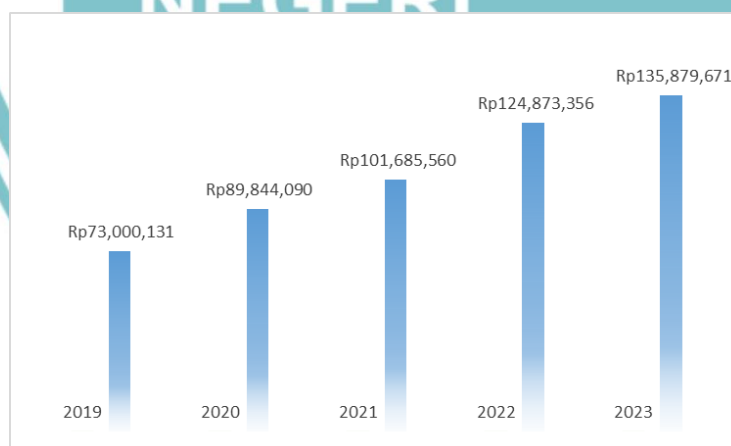
Tabel 1.1 Pembiayaan Akad Murabahah Tahun 2019 - 2023

Bank syariah Indonesia menyediakan berbagai barang dan jasa, termasuk pembiayaan melalui akad Murabahah. Kesepakatan Murabahah dideskripsikan sebagai suatu akad jual beli di mana bank bertindak menjadi penjual, membeli barang atas permintaan klien. Kemudian memasarkan kembali kepada klien dengan margin laba yang telah disetujui. Pembiayaan dengan perjanjian Murabahah yang diberikan oleh BSI menghadapi kenaikan setiap tahunnya, seperti terlihat pada data berikut.