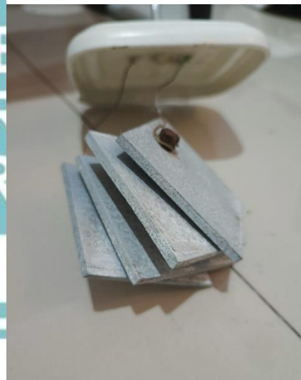
Plat Aluminium tebal 4 mm x 6 cm x 6 cm