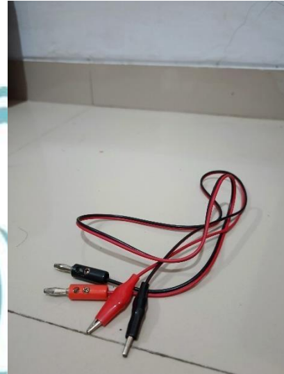
Kabel power supply capit buaya