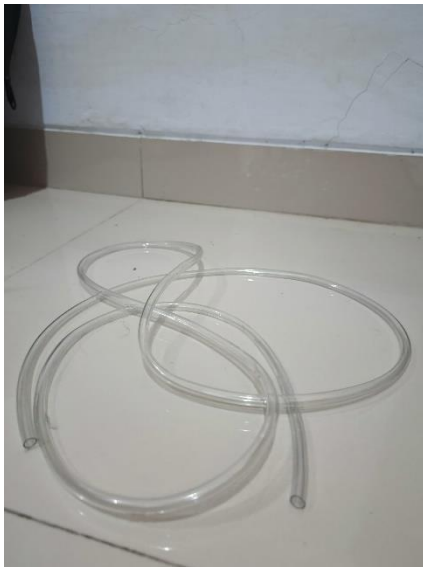
Selang transparan ½ inci