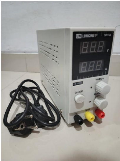
Power Supply (DC)