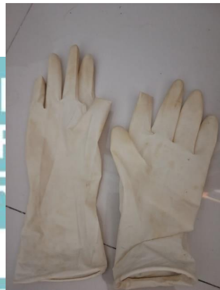
Sarung Tangan Karet