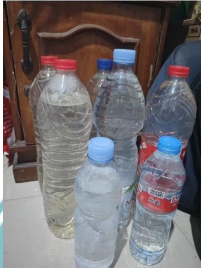
Air Laut Kawasan Priok 5 liter