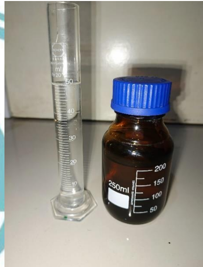
Katalis HCl 250 ml