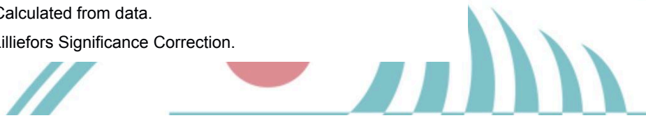
One-Sample Kolmogorov-Smirnov Test