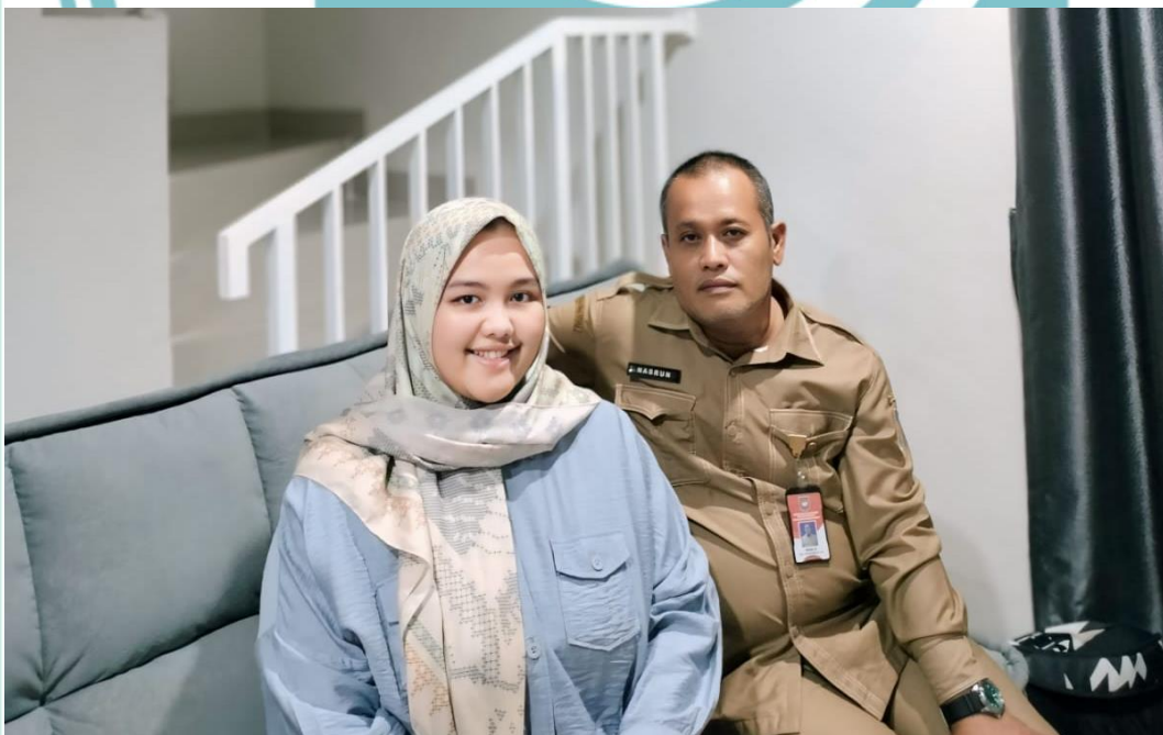
Dokumentasi setelah melakukan wawancara dengan narasumber di kediaman pribadi narasumber.