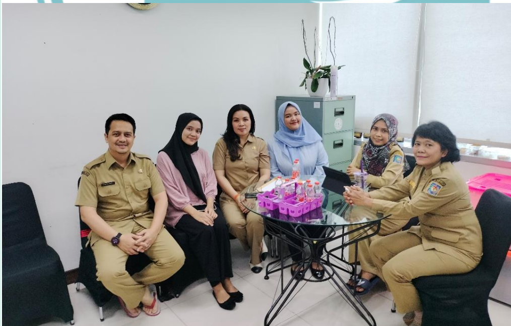
Dokumentasi setelah melakukan wawancara dengan narasumber di Direktorat Pendapatan Daerah Kementerian Dalam Negeri