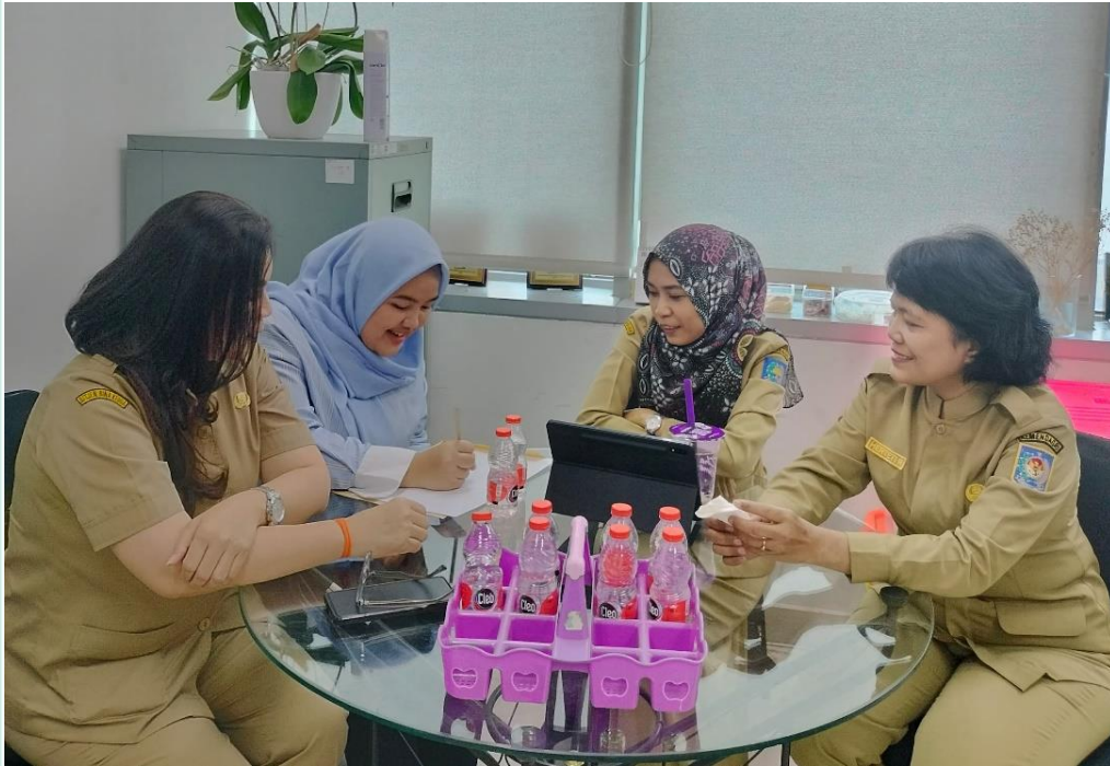
Dokumentasi saat wawancara dengan Narasumber Direktorat Pendapatan Daerah Kementerian Dalam Negeri