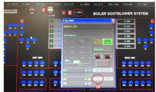
Pengaturan pembukaan valve control supply sootblower