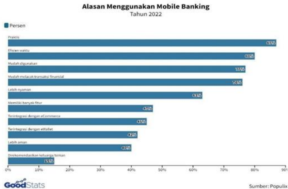
Gambar 1.2 Grafik Alasan Menggunakan Mobile Banking

Livin' by Mandiri juga terus mengalami peningkatan signifikan dalam jumlah pengguna, dengan pertumbuhan sebesar 55% secara year-over-year (YoY) di bulan September 2023, mencapai jumlah pengguna aktif sebanyak 21 juta. Dengan terus melakukan inovasi, layanan ini berhasil mengelola lebih dari 2,02 miliar transaksi hingga akhir September 2023, menunjukkan lonjakan sebesar 46% dibandingkan tahun sebelumnya.