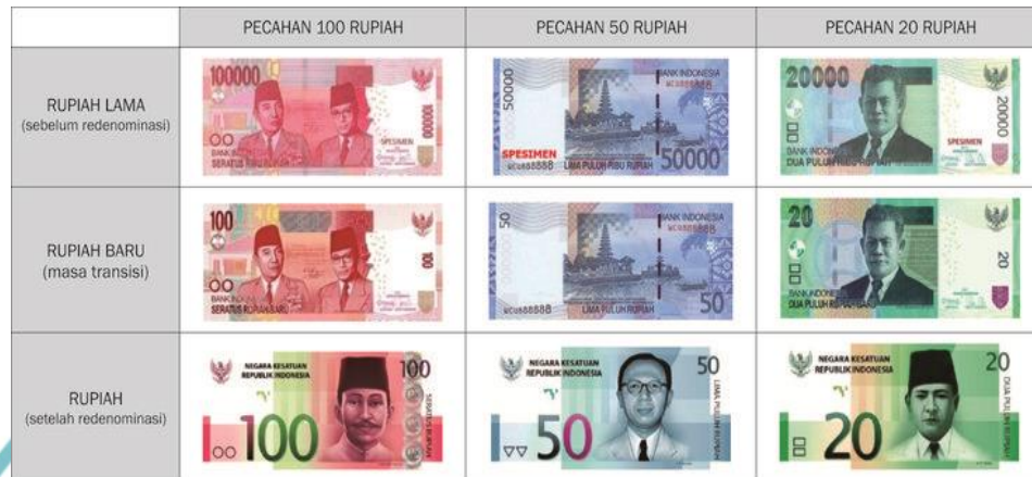
Gambar 1. 1 Redenominasi Rupiah

Berikut adalah gambar yang menunjukkan transisi antara rupiah lama dengan rupiah baru, yaitu: