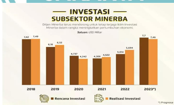
Gambar 1.1 Realisasi Investasi Sektor Pertambangan (2018-2023)

Industri pertambangan di Indonesia memiliki peran yang krusial dalam perekonomian nasional dengan menyediakan peluang pekerjaan dan memberikan kontribusi pendapatan yang besar. Subsektor pertambangan yang tercatat di Bursa Efek Indonesia (BEI) meliputi PT Timah Tbk (TINS), PT Aneka Tambang Tbk (ANTM), PT Vale Indonesia Tbk (INCO), PT Bukit Asam Tbk (PTBA), PT Adaro Energy Tbk (ADRO), PT Bumi Resources Tbk (BUMI), PT Indika Energy Tbk (INDY), PT Harum Energy Tbk (HRUM), PT Tambang Batubara Bukit Asam Tbk (PTBA). Subsektor pertambangan memiliki fokus dan spesialisasi dalam berbagai komoditas tambang seperti nikel, emas, batubara, dan timah, serta berbagai upaya untuk menyediakan sumber daya alam yang penting bagi perekonomian. Hal ini, menimbulkan dampak yang signifikan terhadap pasar saham domestik. Karena itu, Investor cenderung memantau kinerja perusahaan tambang, kebijakan pemerintah terkait industri tambang, dan komitmen perusahaan terhadap keberlanjutan serta hubungan dengan masyarakat lokal. Faktor ini dapat mempengaruhi harga saham untuk investasi di perusahaan tambang. Pada tahun 2023 realisasi investasi di sektor tambang signifikan naik dibandingkan tahun 2022.