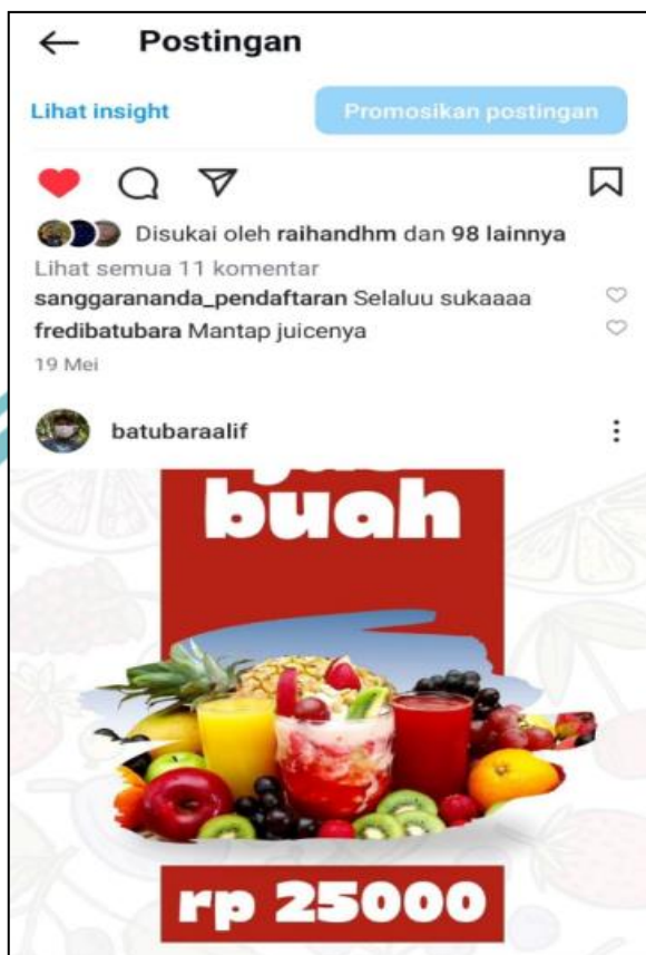
Gambar 4.2 Contoh Bukti Penjualan Jus Al Zain melalui Instagram